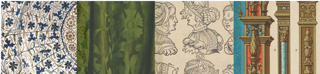
Bildmontage (von links nach rechts): Anonym (Manises/Valencia): Schale mit dem Wappen der Familie Arrighi aus Florenz, Steingut, um 1430–1450, The Ambassadors, 1533, by Hans Holbein the Younger, The National Gallery. Ein fremdes und wunderbares kunstbüchlein, 1538, printed by Heinrich Vogtherr the Elder, Metropolitan Museum of Art. Albert Racinet, Renaissance pattern from L'ornement Polychrome (1888).

Im Rahmen der Basel Graduate School of History veranstaltet vom Departement Geschichte und dem Kunsthistorischen Seminar